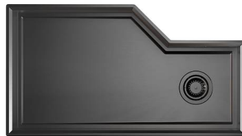
Fregadero Diade Gun Metal 3028 856